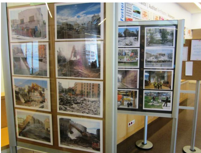
Imatge 2/. Plafons amb sèries fotogràfiques de Josep Martí Valls, en primer terme.