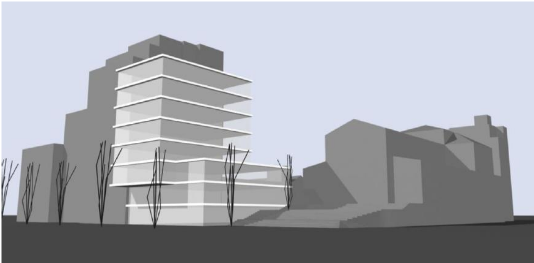
Imatge 3/. Recreació de la proposta de centre social dels arquitectes Brau, Fernández & Llaneras (Nova Gestió, Urbanisme i Arquitectura).