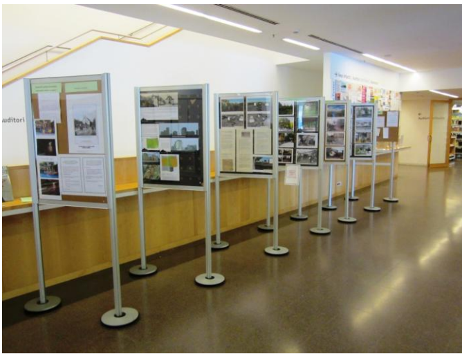
Imatge 1/. Vista general dels plafons de l'exposició al vestíbul de la Biblioteca.